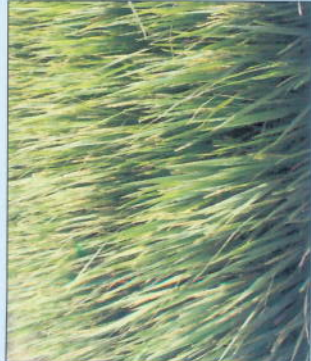
ପତ୍ରପୋଡ଼ା ରୋଗରେ ଆକ୍ରାନ୍ତ ପ୍ଲାଷ୍ଟୋମାଇସିନ୍ ଦ୍ୱାରା ପତ୍ରପୋଡ଼ା ରୋଗ ନିୟନ୍ତ୍ରଣ