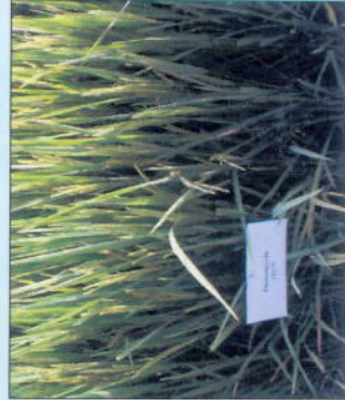
ପତ୍ରପୋଡ଼ା ରୋଗରେ ଆକ୍ରାନ୍ତ ପ୍ଲାଷ୍ଟୋମାଇସିନ୍ ଦ୍ୱାରା ପତ୍ରପୋଡ଼ା ରୋଗ ନିୟନ୍ତ୍ରଣ