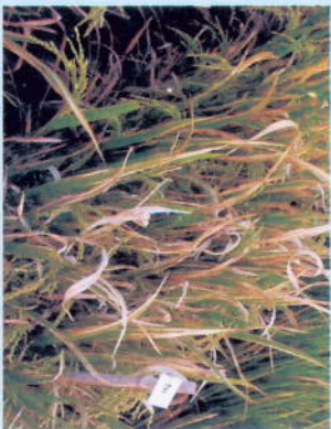
ସକ୍ରିୟ ପିଲ ଅବସ୍ଥାରେ ପତ୍ରପୋଡ଼ା ରୋଗ